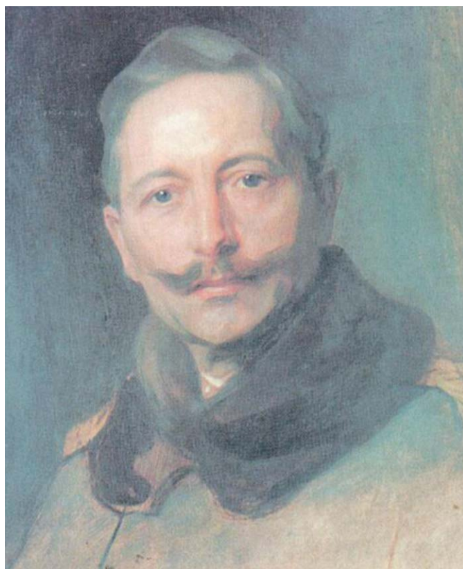
Vilém II. (1859–1914)