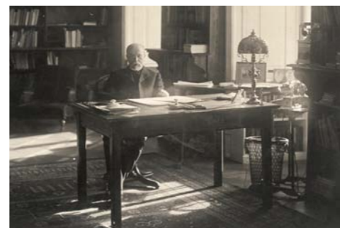
▲ Tomáš Garrigue Masaryk ve své pracovně na Pražském hradě, 1920.

Pracovní list pro žáky 8. a 9. tříd ZŠ a SŠ k expozici Tomáš Garrigue Masaryk a rodný kraj