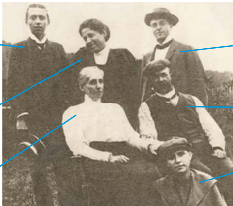
▲ Masarykova rodina v Žabárně u Valašského Meziříčí, 1905.