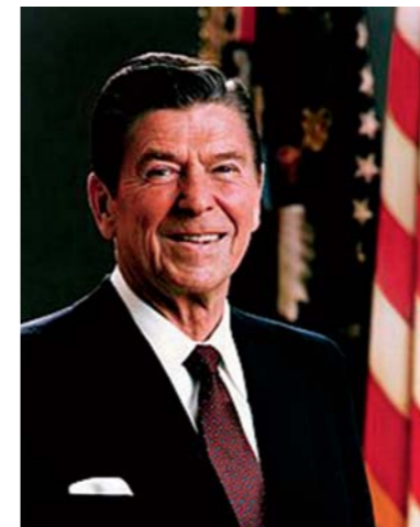
Ronald Reagan (1911–2004)

V Číně proběhly studentské protesty na náměstí Nebeského klidu.