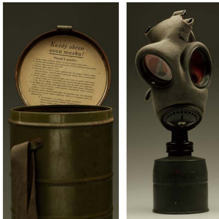
Plynová maska z roku 1938 (Československo).